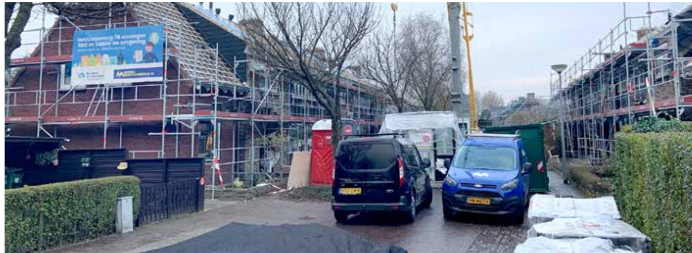
De ruimte voor de inrichting van een bouwplaats was beperkt.