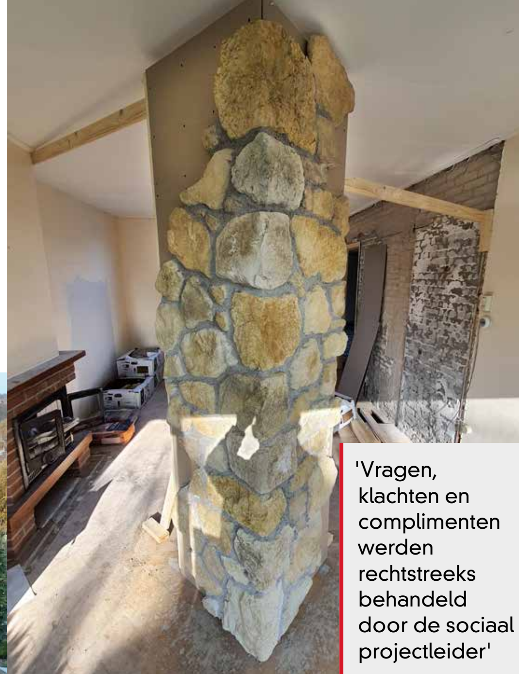
De flagstones zorgen voor een markante uitstraling.

'Vragen, klachten en complimenten werden rechtstreeks behandeld door de sociaal projectleider'