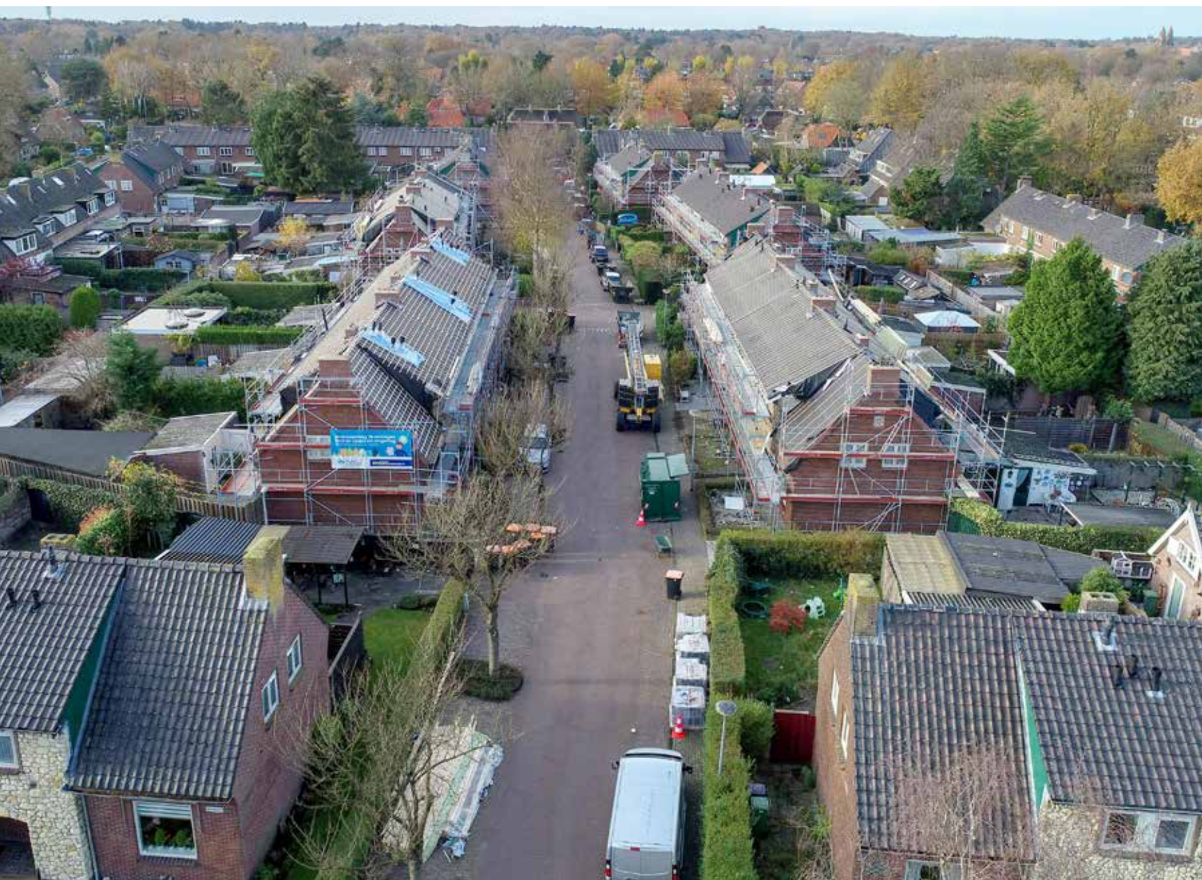
Het uitgebreide pakket aan maatregelen maakte de woningen comfortabel en energiezuinig.

76 woningen aan de Stad en Lande ondergingen een intensieve renovatieslag. Een uitgebreid pakket aan maatregelen maakte de woningen comfortabel en energiezuinig. Ook het verschil in uitstraling is indrukwekkend. "Het zijn weer woningen van deze tijd."